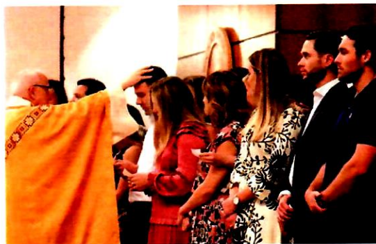
I catecumeni ricevono il segno della croce sulla fronte, segno dell'amore e della vittoria di Cristo.

Questi "gradini" e i previsti "scrutini" servono non solo ai candidati, ma anche all'intera comunità che così poteva approfondire con loro il mistero di Dio che è alla radice della comunione. Il percorso di queste due prime tappe (con i riti della ammissione e della elezione ) si propone dunque come occasione "favorevole" per tutti, poiché la fede è un dono che deve accrescersi nella sua conoscenza, nella responsabilità di trasmetterla nella sua integrità e nella testimonianza credibile. don Giuseppe Militello